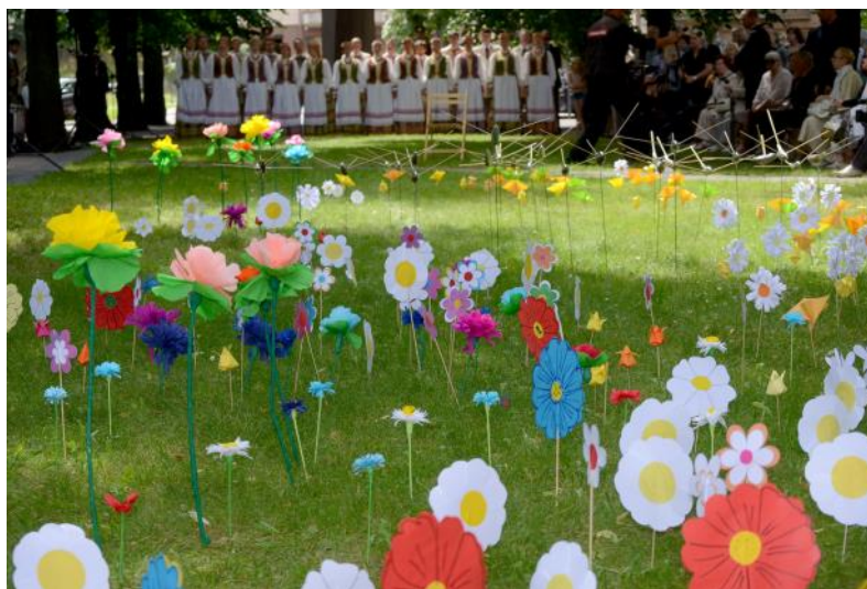
„Ilgesio pieva“ Aukų g., Vilniuje