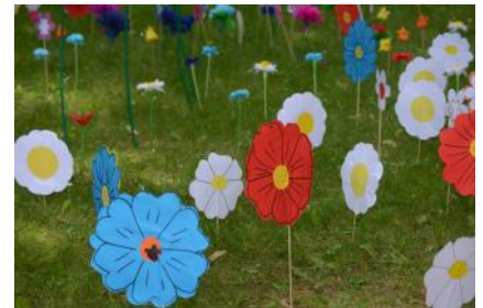
Pasvalio Lėvens pagrindinės mokyklos Valakėlių skyrius