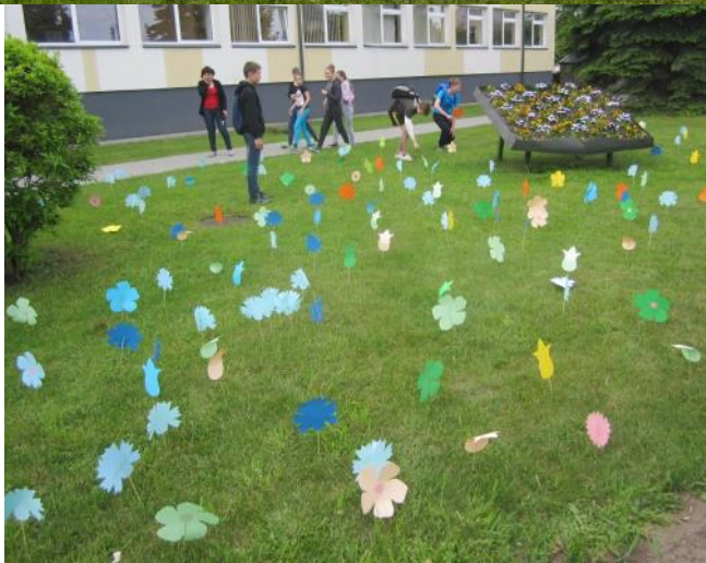
Tauragės Jovarų pagrindinė mokykla