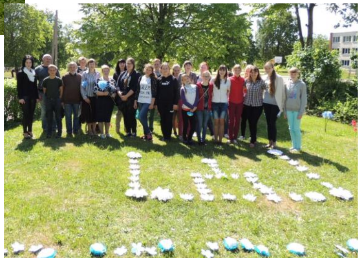
Radviliškio r. Šiaulėnų Marcelino Šikšnio gimnazija