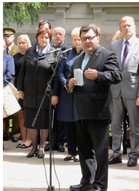
Tarptautinės komisijos pirmininkas ir Lietuvos Respublikos Nepriklausomybės akto signataras Emanuelis Zingeris