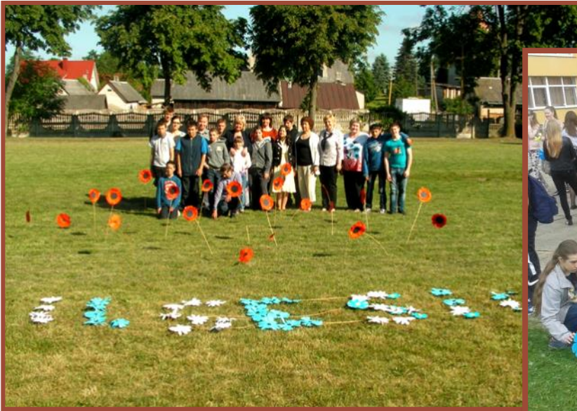
Alytaus r. Simno specialioji mokykla