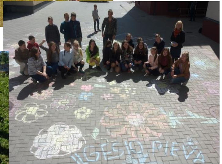
Palangos Vlado Jurgučio pagrindinė mokykla