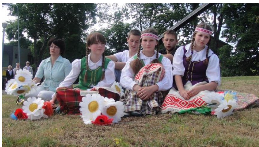
Vilniaus „Vilnios“ pagrindinės mokyklos mokiniai Naujoje Vilnioje