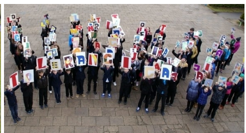
LSU Kėdainių „Aušros“ progimnazija