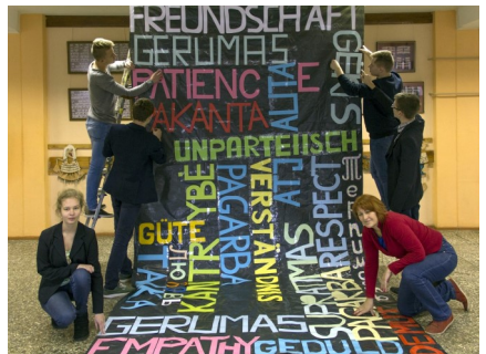
Gargždų „Vaivorykštės“ gimnazija