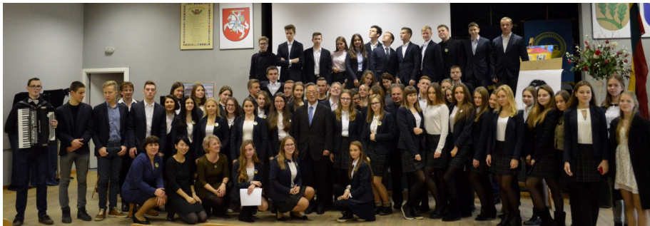
Jonučių gimnazijos mokiniai, mokytojai su svečiais iš Japonijos ambasados