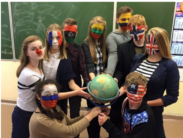
Vilniaus S. Kovalevskajos progimnazija