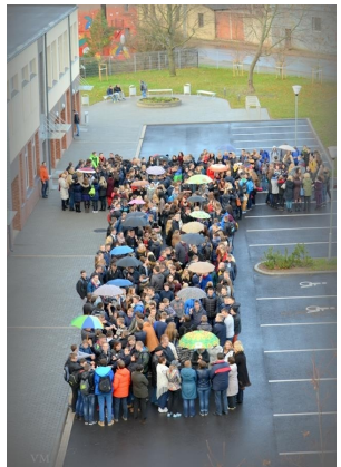
Klaipėdos paslaugų ir verslo mokykla