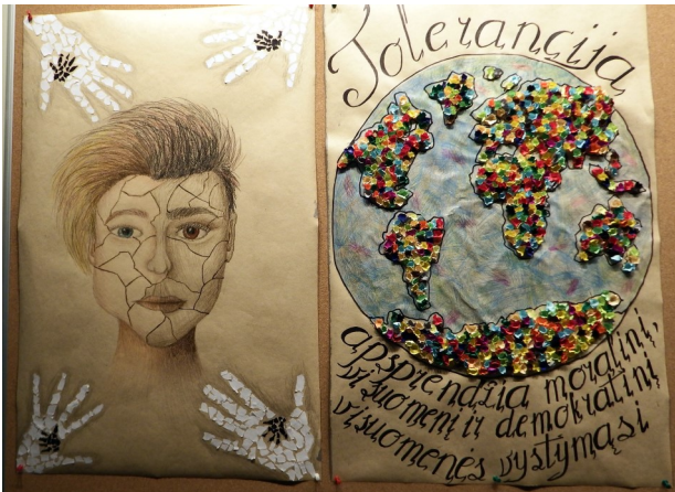
Elektrėnų „Vermės“ gimnazija