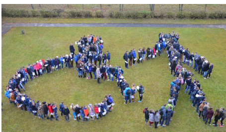
Pavėnių vidurinė mokykla