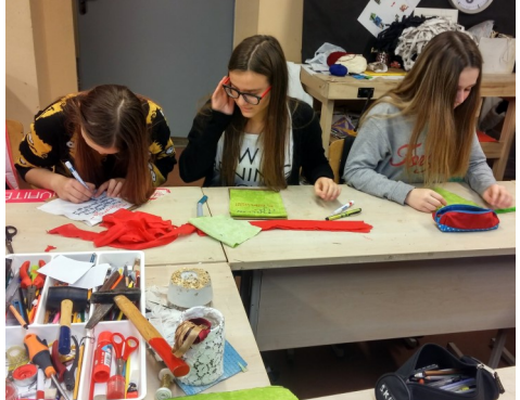
Vilniaus S. Nėries gimnazija