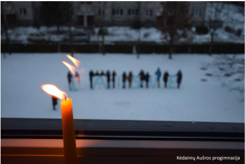
Kėdainių Aušros progimnazija