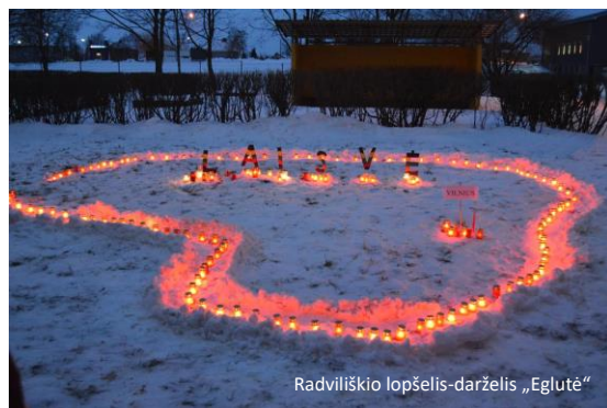
Radviliškio lopšelis-darželis „Eglutė“