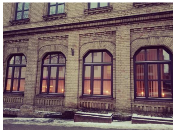
Valstybinio Vilniaus Gaono žydų muziejaus Tolerancijos centras