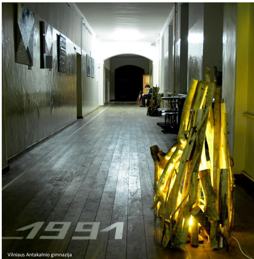
Vilniaus Antakalnio gimnazija