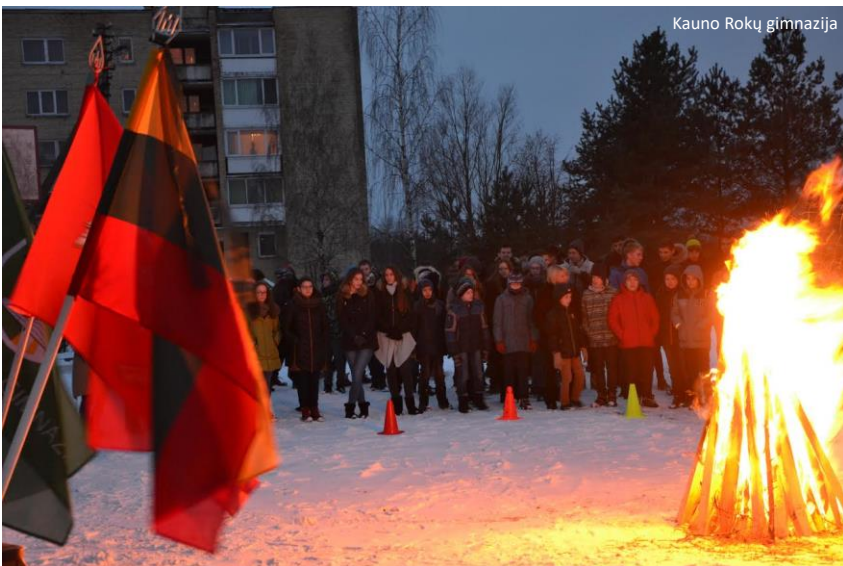
Kauno Rokų gimnazija