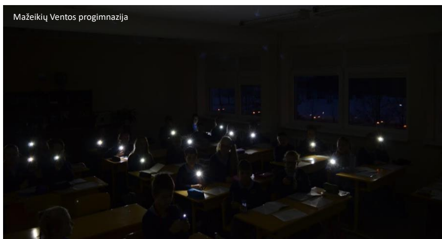
Mažeikių Ventos progimnazija