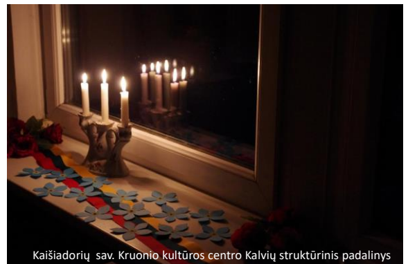
Kaišiadorių sav. Kruonio kultūros centro Kalvių struktūrinis padalinys