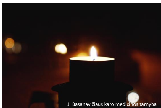
J. Basanavičiaus karo medicinos tarnyba