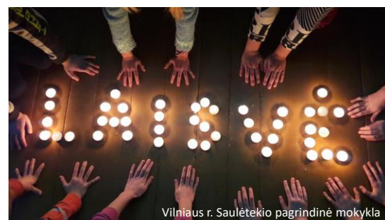
Vilniaus r. Saulėtekio pagrindinė mokykla