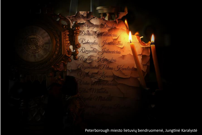
Peterborough miesto lietuvių bendruomenė, Jungtinė Karalystė