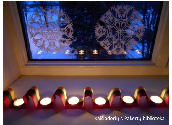
Kaišiadorių r. Pakertų biblioteka