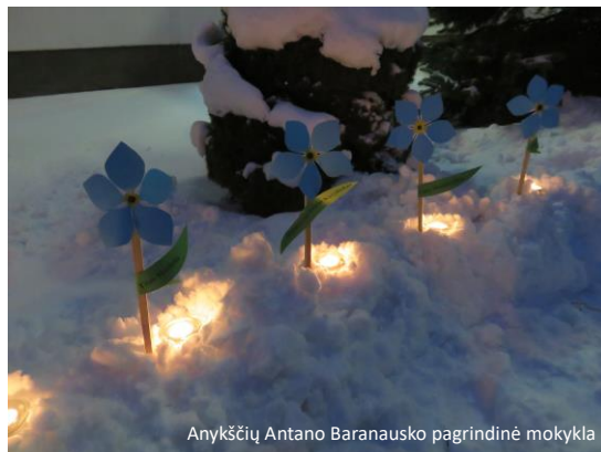
Anykščių Antano Baranausko pagrindinė mokykla