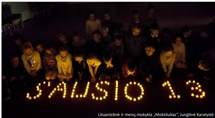
Lituanistinė ir menų mokykla „Mokslukas“, Jungtinė Karalystė