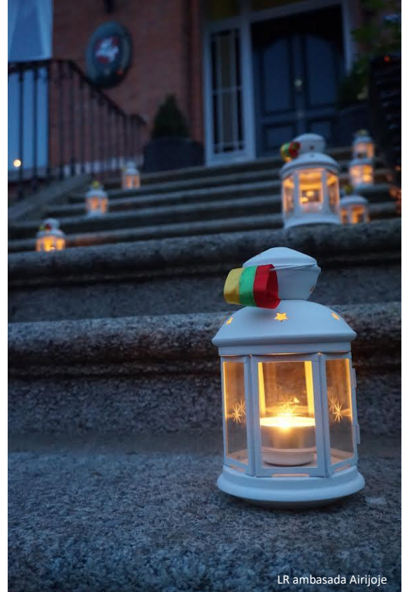
LR ambasada Airijoje