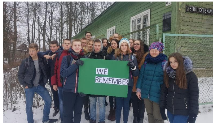
Trakų r. Rūdiškių gimnazija