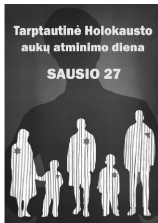
Patricijos Kell darbas