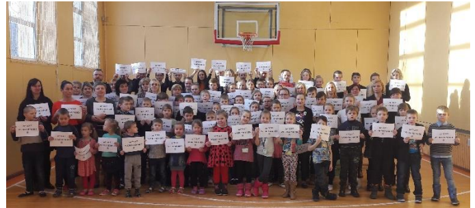
Šilalės r. Obelyno pagrindinė mokykla

Keliolika Tolerancijos ugdymo centrų Lietuvoje prisijungė prie Pasaulinio žydų kongreso inicijuoto projekto „Mes atsimename“, skirto Tarptautinei Holokausto aukų atminties dienai prisiminti.