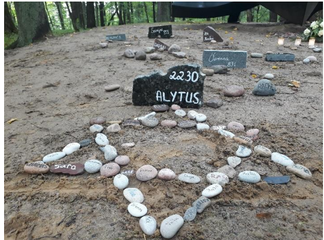
Alytaus A. Ramanausko-Vanago gimnazija

➤ Šėtos gimnazijoje atminimo renginiai vyko keletą dienų: mokiniai ant akmenėlių rašė Kėdainių ir Lietuvos miestelių bei miestų pavadinimus lietuvių ir jidiš kalbomis, iš jų mokyklos fojė sukūrė instaliaciją „Atminties kelias“, vedė netradicines istorijos pamokas, pristatė parodą, filmą Holokausto tema ir lankė žydų kapines.