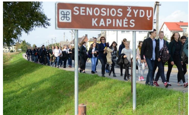
Jonučių progimnazija ir gimnazija, Juozo Lukšos gimnazija

➤ Šiaulėnų Marcelino Šikšnio gimnazijos iniciatyva Šiaulėnuose ir Radviliškio Lizdeikos gimnazijos iniciatyva Radviliškyje pirmą kartą buvo perskaityti nužudytų žydų vardai. Minėtuose miesteliuose iki šiol nebuvo žinomi nužudytųjų sąrašai, mokytojų iniciatyva duomenys buvo parsisiųsti iš Yad Vashem – tarptautinio studijų apie Holokaustą instituto Izraelyje.