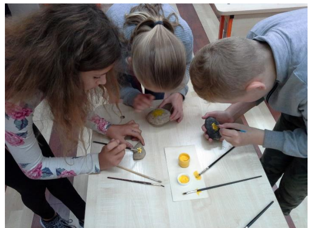
Alytaus Likiškėlių pagrindinė mokykla