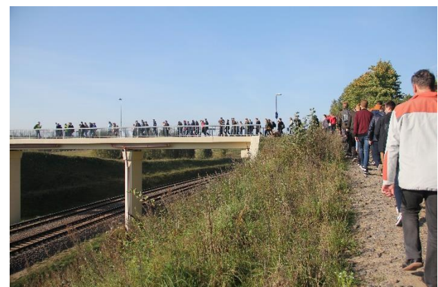
Vilniaus „Laisvės“ gimnazijos „Atminties kelias“ į Veliučionis