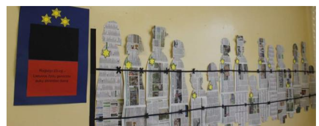
Jonavos r. Bukonių mokykla-daugiafunkcis centras