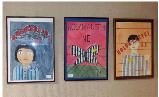
Panevėžio Rožyno progimnazija