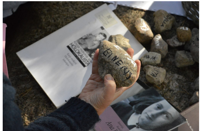
Užlieknės pagrindinė mokykla, Mažeikių raj.