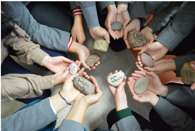
Alytaus r. Butrimonių gimnazija

Tarptautinės komisijos sekretoriatas, pilietinę iniciatyvą „Atminties kelias“ inicijuoja nuo 2013 metų. Toks paminėjimas jau tapo tradiciniu – mokytojai su mokiniais, skirtingose Lietuvos vietose, rugsėjo 23-iąją lanko masines žydų žūtis vietas, organizuoja gyvasias istorijos pamokas, paminėjimo renginius.