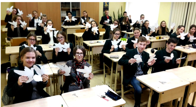
Tauragės Žalgirių gimnazija