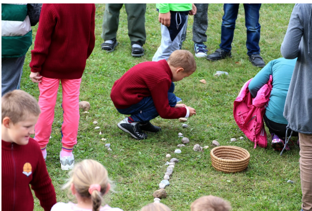
Šiaulių r. Meškuičių gimnazija