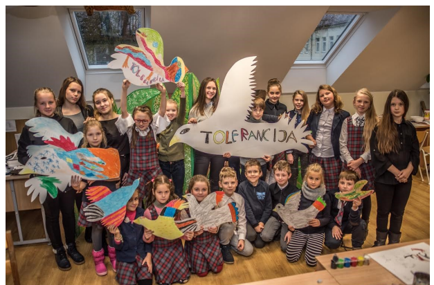
Vievio meno mokykla