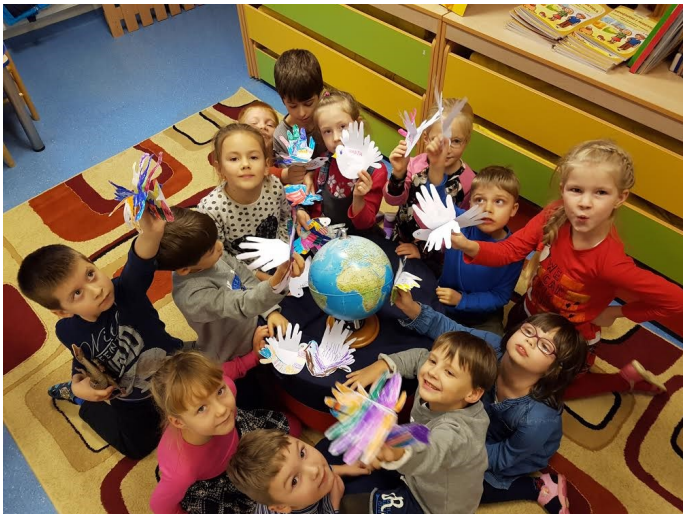
Pagirių Pelėdžiuko darželis

Šiais metais tarptautinę Tolerancijos dieną minėjo daugiau nei 900 mokyklų, darželių, neformalaus švietimo įstaigų. Šių metų simbolis – Tolerancijos paukštis. Pilietinės iniciatyvos dalyviams buvo siūloma naudojant paukščio simbolį tolerancijos temą plėtoti pasitelkus pavyzdžius iš gamtos, žmonių gyvenimo ir istorijos.