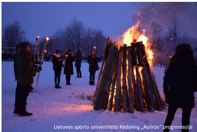
Lietuvos sporto universiteto Kėdainių „Aušros“ progimnazija

Tarptautinė komisija nacių ir sovietinio okupacinių režimų nusikaltimams Lietuvoje įvertinti