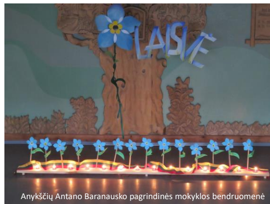
Ankščių Antano Baranausko pagrindinės mokyklos bendruomenė

>>> Šią pilietiškumo iniciatyvą Tarptautinė komisija organizuoja kasmet nuo 2008 metų. Ji yra „Mokymo apie totalitarinių režimų nusikaltimus, nusikaltimų žmoniškumui prevencijos ir tolerancijos ugdymo programos“ sudėtinė dalis.