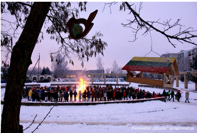
Panevėžio „Ažuolo“ progimnazija