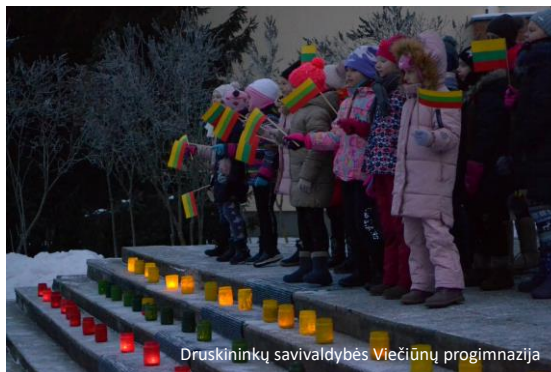
Druskininkų savivaldybės Viečių progimnazija