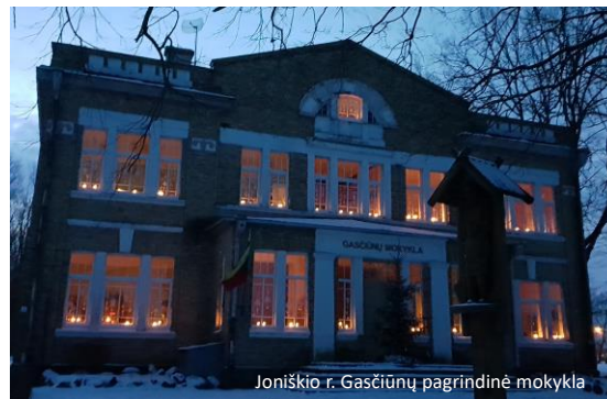
Joniškio r. Gasčiūnų pagrindinė mokykla