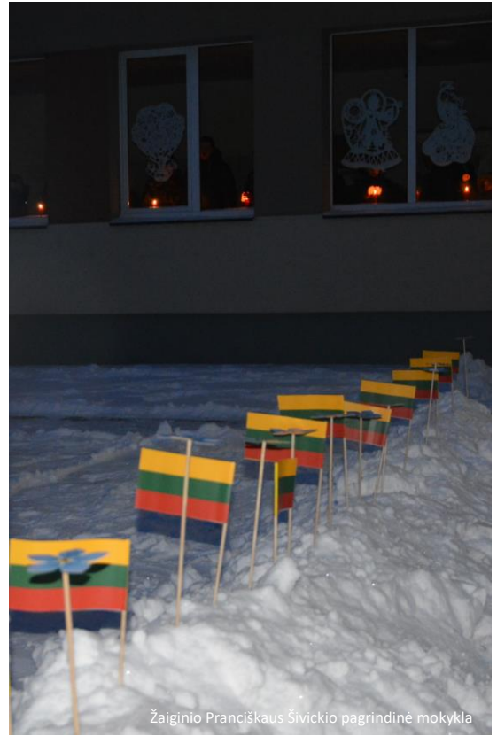
Žaigino Pranciškaus Šivickio pagrindinė mokykla