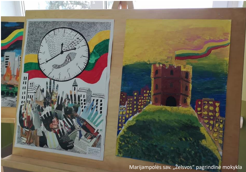
Marijampolės sav. „Želsvos“ pagrindinė mokykla