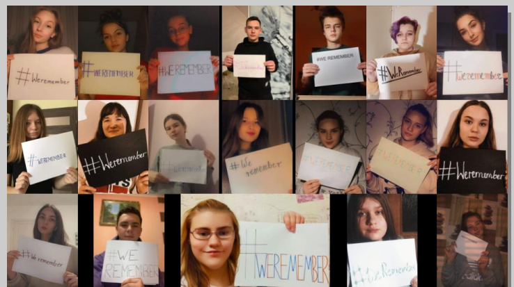
Vilniaus Adomo Mickevičiaus licejus