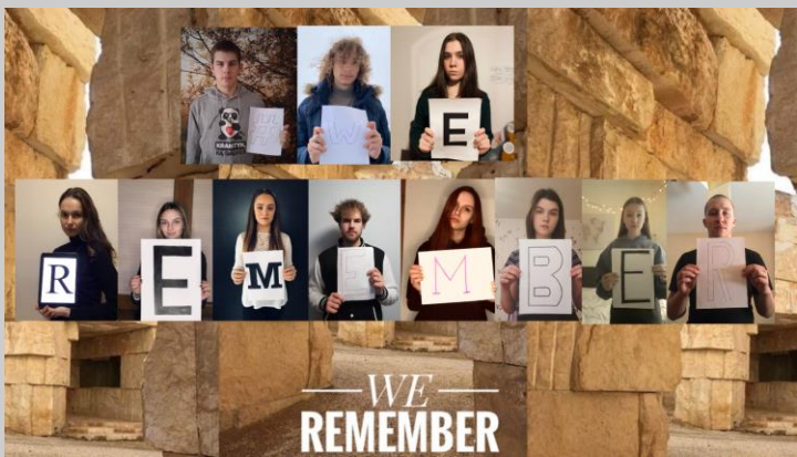
Mokinių delegacija, 2019 metais vykusi į Izraelį, “Lita Youth Mission 2”

Tolerancijos ugdymo centrai bei kitos švietimo įstaigos prisijungė prie Pasaulinio žydų kongreso inicijuojamos akcijos #Mes Prisimename / #We Remember. Iniciatyva skirta tarptautinei Holokausto aukų dienai atminti. Ugdymo procesui vykstant nuotoliniu būdu, mokytojai su mokiniais darė originalias foto nuotraukas su užrašu #WeRemember ir siuntė akcijos organizatoriams, publikavo fb socialiniuose tinkluose, mokyklų internetinėse svetainėse.