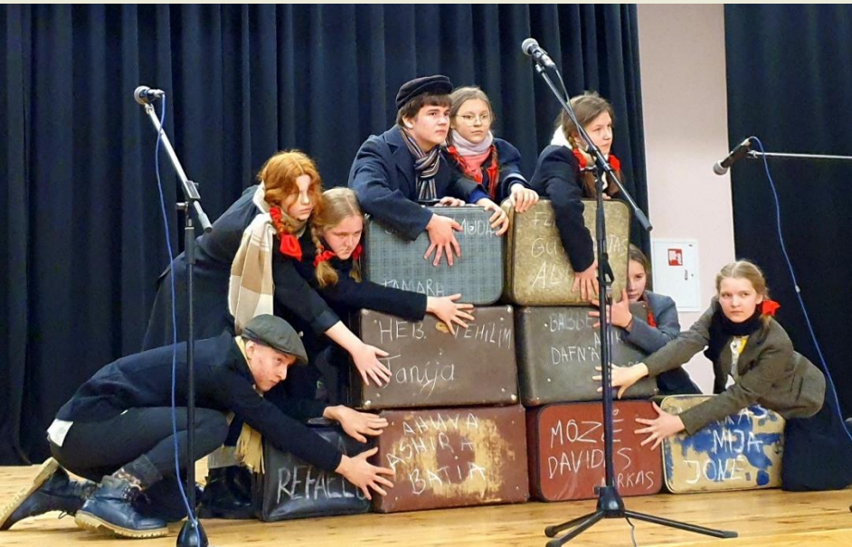
Alytaus r. Daugų V. Mirono gimnazijos mokiniai