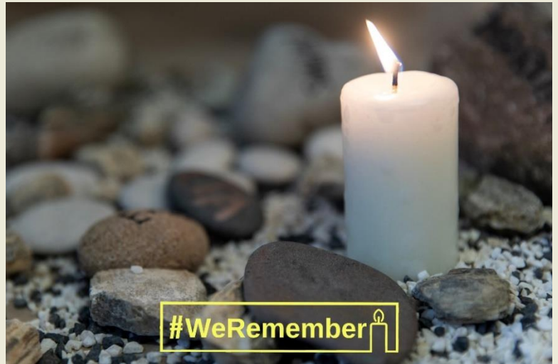
Lietuvos Respublikos Vyriausybė