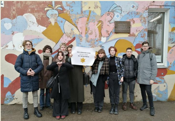
Kauno dailės gimnazijos mokiniai