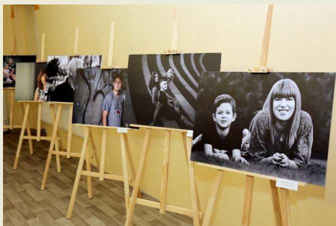
Fotografijų paroda „Žydai anuomet ir dabar...“

Tarptautinė Holokausto aukų atminimo diena buvo minima daugelyje Tolerancijos ugdymo centrų. Mokytojai organizavo pamokas šiai datai atminti, filmų peržiūras, mokyklinės konferencijas bei įgyvendintų projektų Holokausto tema pristatymus.