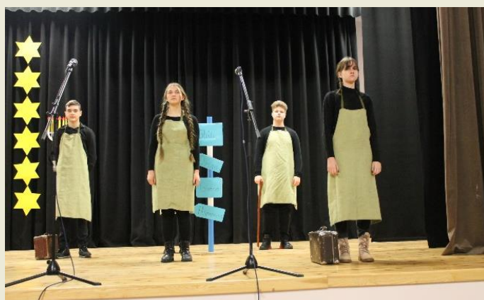
Kalvarijos gimnazijos mokiniai