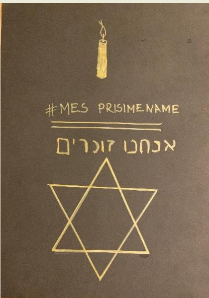
Vilniaus A. Vienuolio progimnazija