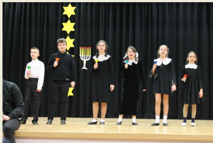
Alytaus TUC pasirodymas

Renginį organizavo Tarptautinės komisijos sekretoriatas kartu su Ariogalos gimnazijos Tolerancijos ugdymo centru, kuris pavadintas Pasaulio tautų teisulės – Janinos Tarapaitės–Šliburienės vardu.