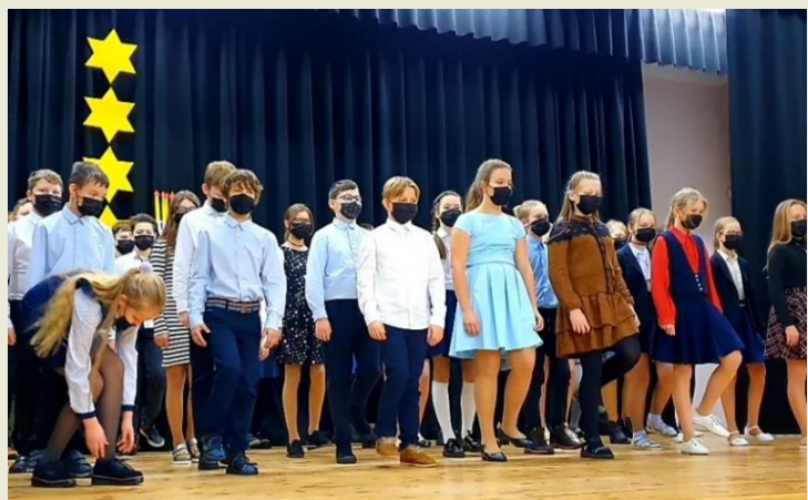
Raseinių r. Ariogalos gimnazijos mokiniai