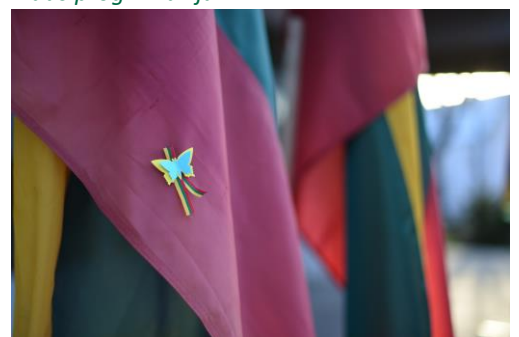
Radviliškio miesto kultūros centras

Pilietinė iniciatyva „Gyvasis Tautos Žiedas“ skirta švietimo įstaigoms, mokykloms bei darželių bendruomenių nariams žaismingai ir patraukliai paminėti vieną svarbiausių valstybės istorinių datų – Kovo 11-ąją. Šiais metais švietimo bendruomenių nariai šventės išvakarėse, kūrybiškai naudodami Lietuvos ir Ukrainos vėliavų spalvas, kūrė foto nuotraukas, panaudodami trispalvę, lietuvišką simboliką ir, žinoma, savo vaizduotę.