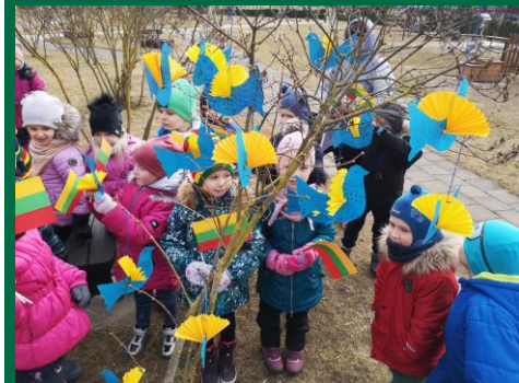
Panevėžio lopšelis – darželis „Puriena“