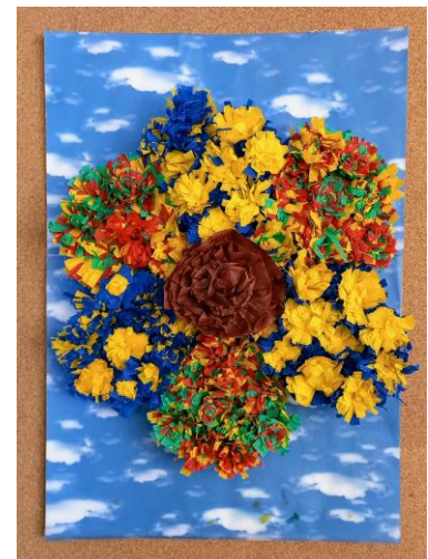
Gargždų „Kranto“ pagrindinė mokykla