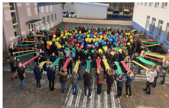
Kretingos rajono Darbėnų gimnazija