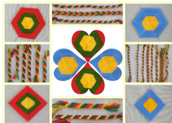
Vilniaus „Saulės“ privati mokykla

Daugiau informacijos: https://www.komisija.lt/