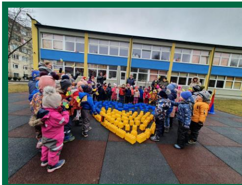
Šiaulių lopšelis – darželis „Ažuoliukas“