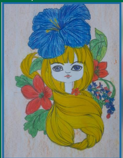
Vilniaus rajono Riešės vaikų darželis