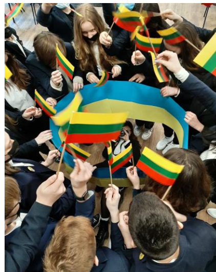
Kėdainių „Aušros“ progimnazija

Pilietinė iniciatyva „Gyvasis Tautos Žiedas“ vyksta nuo 2014 metų. Ją organizuoja Tarptautinė komisija kartu su šios idėjos autoriais – Panevėžio Kastyčio Ramanausko lopšeliu – darželiu.