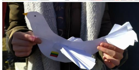
Prienų Revuonos pagrindinė mokykla