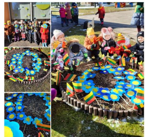
Panevėžio lopšelis – darželis „Aušra“