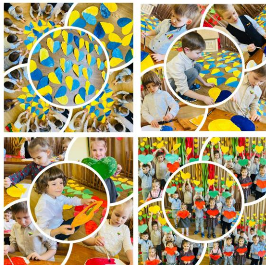
Kauno lopšelis – darželis „Smalsutis“