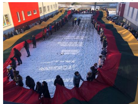
Kėdainių r. Akademijos gimnazija