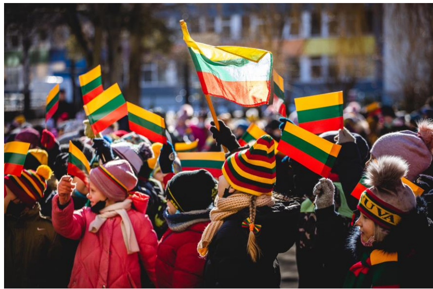
Kauno Kazio Griniaus progimnazija