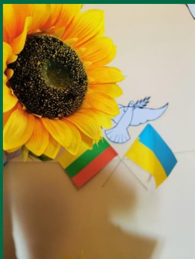
VŠĮ Kazlų Rūdos socialinės paramos centras

Pilietinė iniciatyva „Gyvasis Tautos Žiedas“ vyksta nuo 2014 metų. Ją organizuoja Tarptautinė komisija kartu su šios idėjos autoriais – Panevėžio Kastyčio Ramanausko lopšeliu – darželiu.