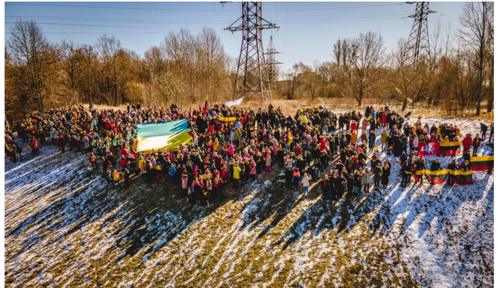
Kauno Kazio Griniaus progimnazija