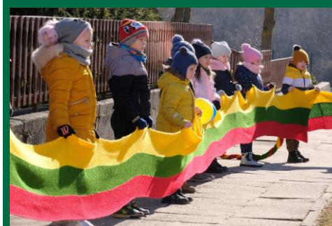
Akmenės r. Papilės Simono Daukanto gimnazijos ikimokyklinio ugdymo skyrius