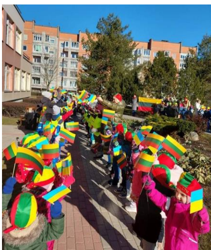
Klaipėdos lopšelis – darželis „Ažuoliukas“