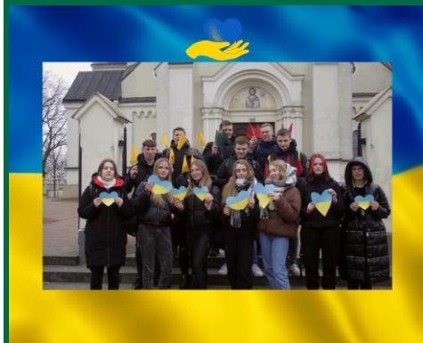
Tauragės „Vermės“ gimnazija