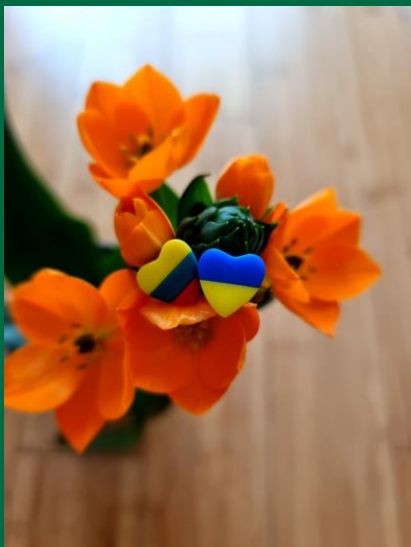
Vilniaus „Sietuvos“ progimnazija

Minint trisdešimt dvejus metus nuo Lietuvos Nepriklausomybės atkūrimo ir solidarizuojantis su Ukrainos tauta, kuri šiuo metu kruviname kare kovoja už savo laisvę, 383 Lietuvos švietimo institucijos prisijungė prie pilietinės iniciatyvos „Gyvasis Tautos Žiedas“.