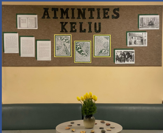
Visagino Žiburio pagrindinė mokykla