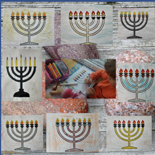
Jurbarko „Ažuoliuko“ mokykla