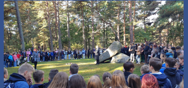
Palangos Vlado Jurgučio progimnazija