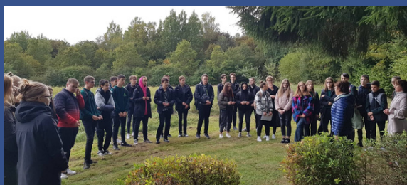
Radviliškio Lizdeikos gimnazija