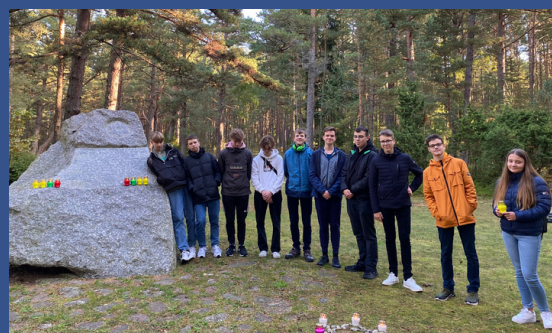
Palangos senoji gimnazija