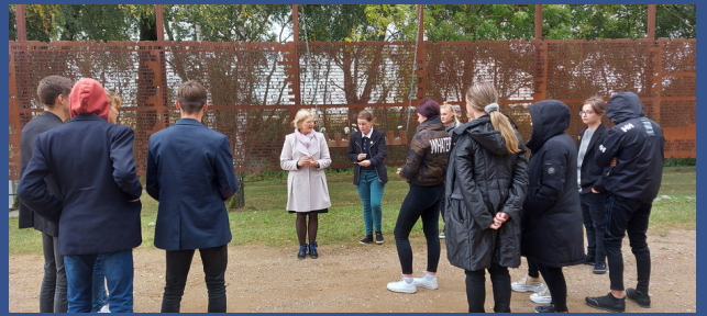
Kėdainių r. Surviliškio Vinco Svirskio pagrindinė mokykla