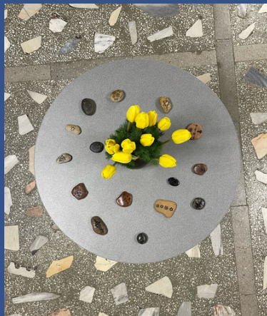
Visagino Žiburio pagrindinė mokykla