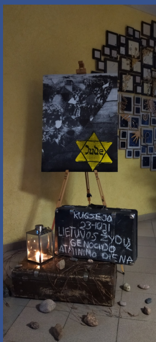
Klaipėdos universiteto „Žemynos“ gimnazija