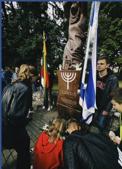
Panevėžio J. Balčikonio gimnazija