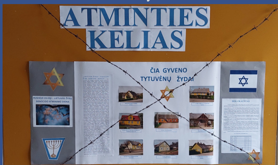
Kelmės profesinio rengimo centro Tytuvėnų skyrius