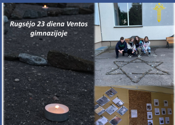
Akmenės r. Ventos gimnazija