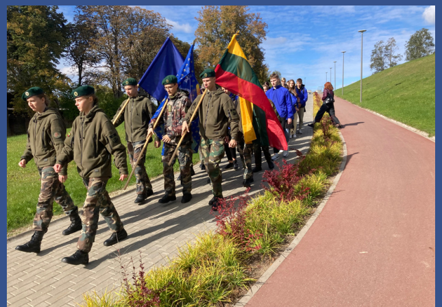
Mažeikių Gabijos gimnazija

Apie 160 Lietuvos miestų ir miestelių švietimo institucijų, muziejų ir kt. institucijų organizavo Lietuvos žydų genocido aukų atminimo dienos paminėjimo renginius. Dalis jų organizavo Atminties kelią – vykimą į Holokausto aukų vietą pėsčiomis arba autobusais. Kai kuriose mokyklose vyko filmų peržiūros ir aptarimai bei buvo organizuojami kiti paminėjimo renginiai.