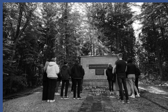
Klaipėdos universiteto „Žemynos“ gimnazija