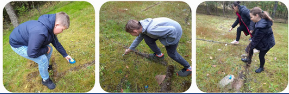
Raseinių r. Nemakščių Martyno Mažvydo gimnazija