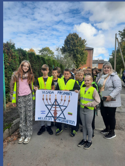
Radviliškio r. Šiaulėnų Marcelino Šikšnio gimnazija