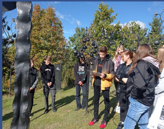
Plungės r. Liepijų mokykla